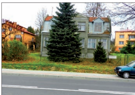
Nieruchomość do sprzedania w Kuńkowcach

Zainteresowanych zakupem nieruchomości na terenie gminy Przemysł zapraszamy do odwiedzenia naszych stron internetowych: Biuletynu Informacji Publicznej BIP pod adresem: http://gminaprzemysl.home.pl/bip/ - dział „NIE- RUCHOMOŚCI” lub oficjalnej strony Urzędu Gminy Przemysł pod adresem: http://www.gminaprzemysl.home.pl/ zakładka „MIENIE GMINY”.